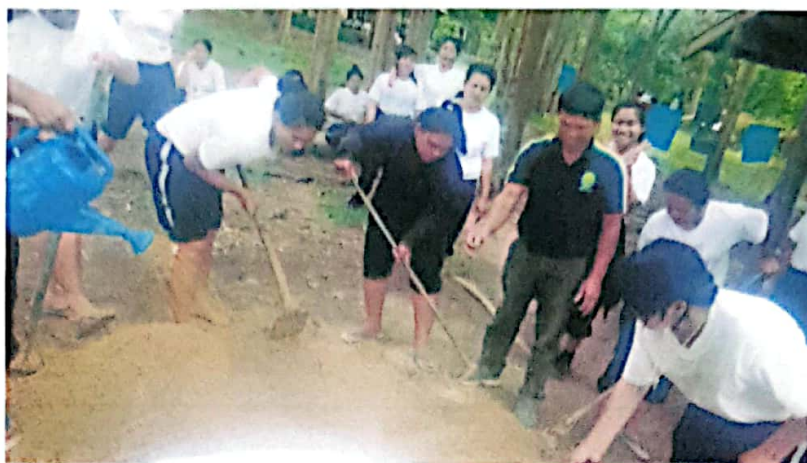
การถ่ายทอดความรู้ให้แก่กลุ่มวิวัฒน์พลเมือง ค่ายฝึกการรบพิเศษ(หนองตะกุง)