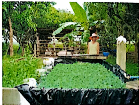
ภาพบ่อเลี้ยงปลาดุก และการปลูกพืชผักสวนครัว

ภาพบ่อเลี้ยงปลาดุก และการปลูกพืชผักสวนครัว ปี พ.ศ. ๒๕๕๙