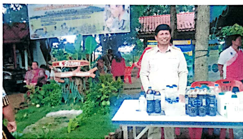
การถ่ายทอดความรู้ การทำจุลินทรีย์ EM โครงการจังหวัดเคลื่อนที่ ต.วังกระแจะ อ.ปากช่อง